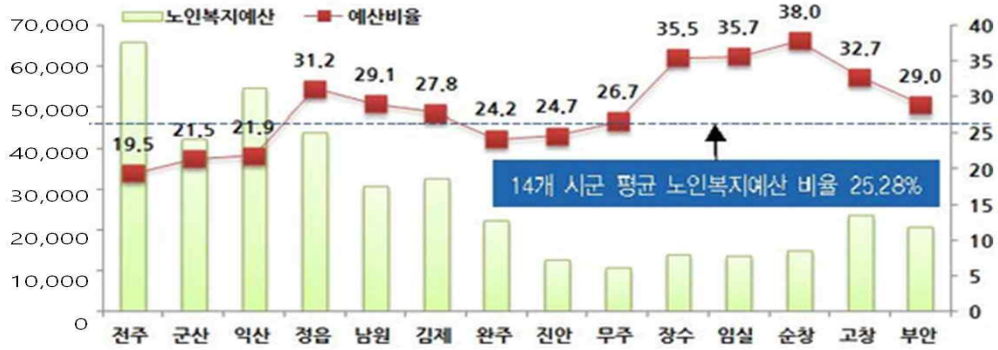
<전라북도 시군별 노인복지 예산> * 출처 : 전북연구원(2017)