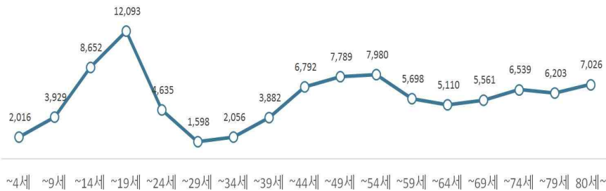
<연령별 기초 생활 수급자 현황>