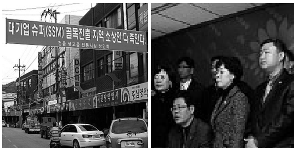
재래시장 골목상권을 지키는 SSM 진입규제